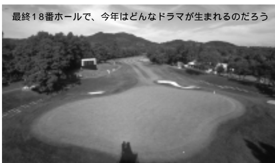
最終18番ホールで、今年はどうなドラマが生まれるのだろうか

コースセッティングについては、いいショットに対しては次打できちんとしたショットが打てるチャンスを与え、ミスショットには