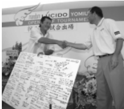
1000試合出場を達成したジャンボ尾崎

マンダムルシードよみうりオープンで、尾崎将司が1970年のデビュー戦「関東オープン」から数えて1000試合出場の快挙を達成した。